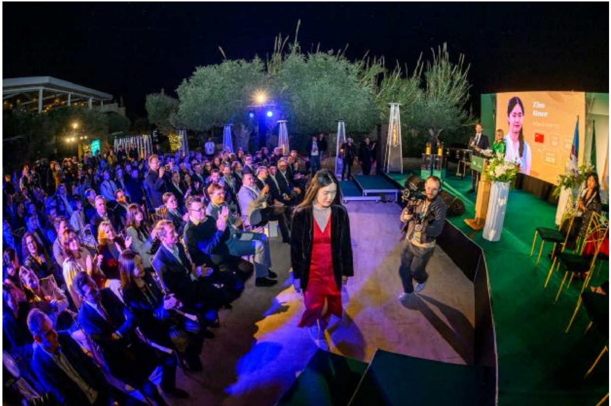
A cerimônia acabou acontecendo ao ar livre, afinal.

Perto do fim do tempo previsto, começou a cair uma leve chuva, gerando certa preocupação, já que a cerimônia de abertura estava programada para acontecer ao ar livre. Felizmente, o plano alternativo em ambiente interno não precisou ser acionado, pois o clima acabou colaborando.