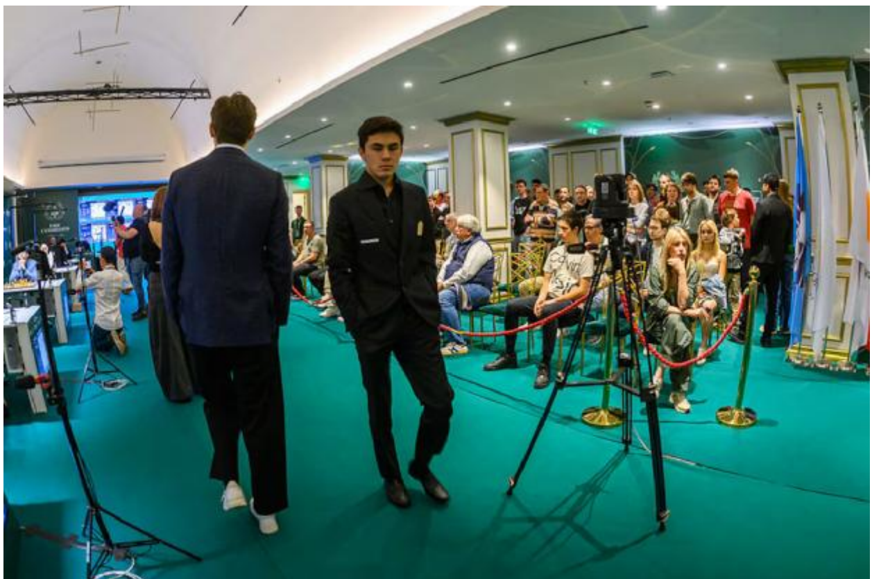
Sindarov caminha pelo palco neste domingo durante sua partida contra Giri.

Yavojir Sindarov só sofreu um pouco na rodada inaugural contra o russo Andrey Esipenko, que logo desperdiçou sua vantagem com um erro tático que o levou à derrota. Depois disso, o uzbeque de 20 anos cedeu apenas dois empates: no dia seguinte, contra o ultrassólido alemão Matthias Bluebaum; e neste domingo, contra o também sólido holandês Anish Giri. O líder chega ao descanso de segunda-feira com 1,5 ponto de vantagem sobre o americano Fabiano Caruana. No Torneio de Candidatas, também disputado em Peyia (Chipre), a líder é a ucraniana Anna Muzychuk, com meio ponto à frente da indiana Rameshbabu Vaishali.