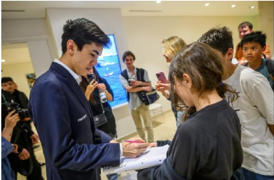
Sindarov dando autógrafos

Após comentar o evento ao lado de Jan Gustafsson, Peter Svidler descreveu o torneio de Sindarov como “avassalador, impressionante e fantástico”. Svidler também classificou esta edição do Candidates como “uma para a história”, sugerindo que o triunfo dominante de Sindarov será lembrado por muito tempo.