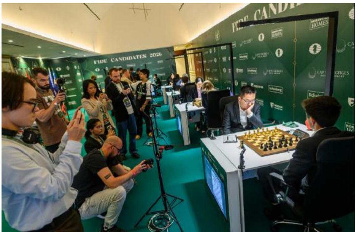
A partida de Sindarov foi o centro das atenções

“Por enquanto não penso em ser campeão mundial”, repetiu Sindarov na coletiva de sexta-feira, após derrotar outro dos favoritos, o americano Hikaru Nakamura. E completou: “Meu objetivo agora é me consolidar entre os cinco melhores do mundo. É nisso que estou focado. Comecei muito bem no Candidates, mas ainda falta muito”.