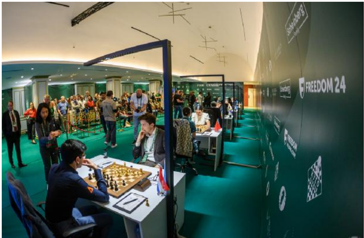
Vista panorâmica do salão de jogos

Anish Giri também venceu, superando Andrey Esipenko com as peças pretas e voltando a um aproveitamento de 50%, enquanto as outras duas partidas terminaram empatadas antes do primeiro dia de descanso do torneio.