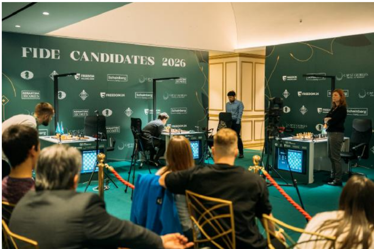
O público presente pode assistir às partidas bem de perto

Todas as quatro partidas da segunda rodada do Torneio de Candidatos, em Chipre, terminaram em empate, mantendo a classificação inalterada. Fabiano Caruana, Praggnanandhaa Rameshbabu e Javokhir Sindarov seguem empatados na liderança, com 1,5 ponto em 2 possíveis. Pragg e Andrey Esipenko tiveram as melhores chances de lutar por mais do que um empate na segunda-feira, mas seus adversários conseguiram manter a situação sob controle. A terceira rodada trará um confronto direto entre líderes, com Pragg jogando de brancas contra Sindarov.