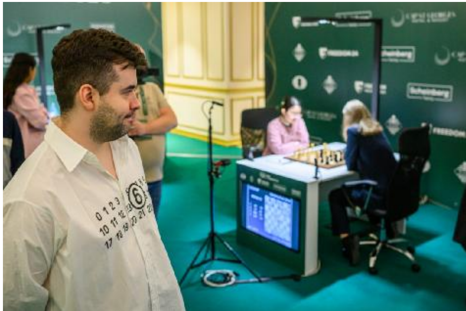
O bicampeão do Candidates, Ian Nepomniachtchi, visitou o salão de jogos e revelou que o fez “apenas como turista”

As outras duas partidas da rodada terminaram empatadas. Pragg não conseguiu converter uma clara vantagem contra Wei Yi, enquanto Nakamura pressionou em um final técnico ligeiramente favorável, mas não conseguiu garantir o ponto completo contra Andrey Esipenko.