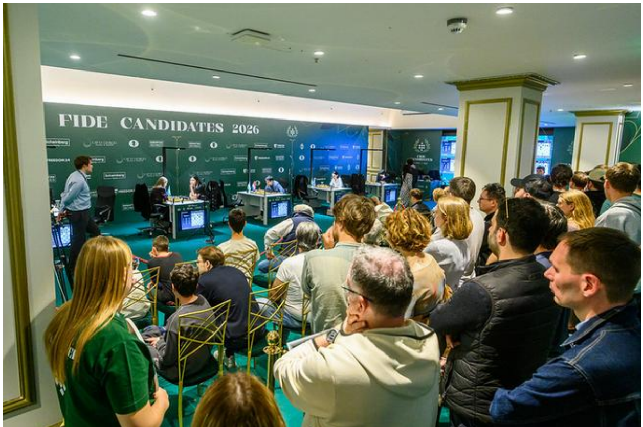
Um seletor público assiste aos jogos

Javokhir Sindarov chegou à metade do Torneio de Candidatos, em Chipre, com uma vantagem de 1,5 ponto após empatar com Anish Giri a partir de uma posição favorável na sétima rodada. Enquanto isso, Wei Yi conquistou sua primeira vitória no evento com uma atuação ofensiva afiada contra Andrey Esipenko. As outras duas partidas terminaram empatadas, mantendo Fabiano Caruana como o principal perseguidor de Sindarov na entrada da segunda metade do torneio.