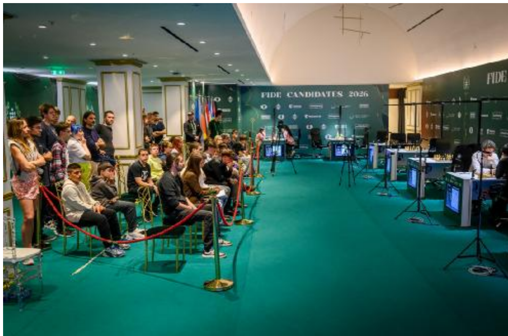
Vista panorâmica do salão de jogos