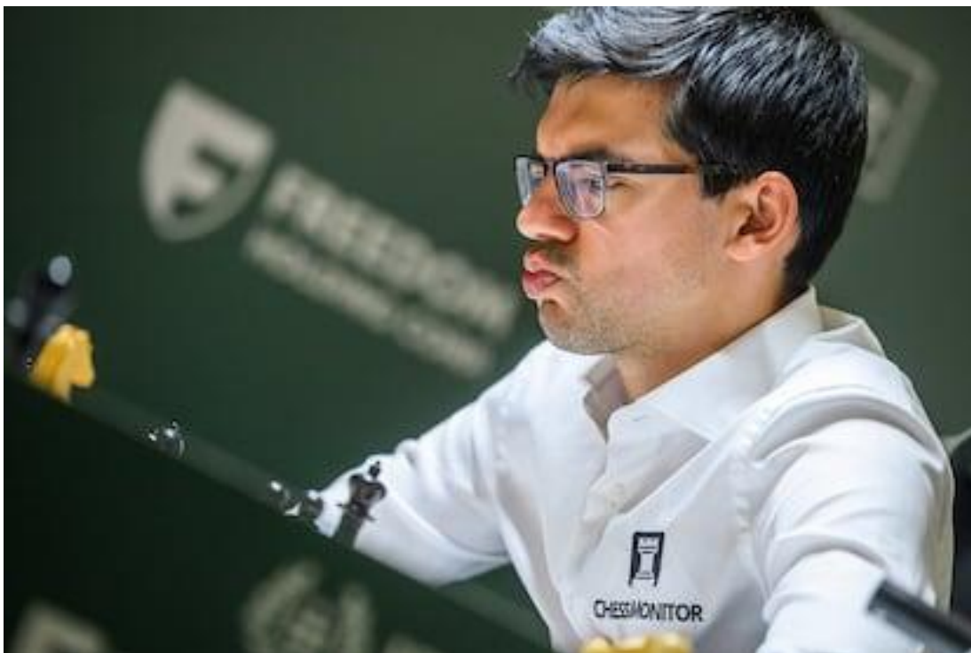
Giri fazendo biquinho...

4/9/2026 – Anish Giri assumiu o segundo lugar isolado no Torneio de Candidatos, em Chipre, após derrotar Fabiano Caruana com as peças pretas na nona rodada de quarta-feira. O líder Javokhir Sindarov ficou no empate com Matthias Bluebaum depois de desperdiçar chances de vitória, permanecendo 1,5 ponto à frente de Giri. As outras duas partidas terminaram empatadas, incluindo um confronto tenso no qual Praggnanandhaa Rameshbabu não conseguiu converter uma clara vantagem contra Wei Yi.