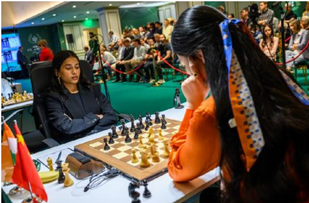
O torneio de candidatas (feminino) se desenrola paralelamente, no mesmo local