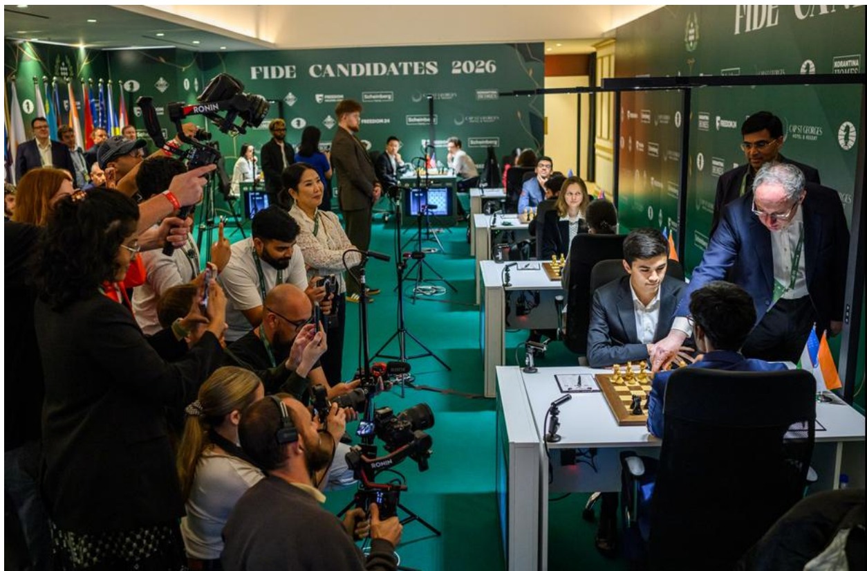
Jornalistas atentos documentando todo o evento. À direita, Boris Gelfand dá o lance inicial na partida de Sindarov

Javokhir Sindarov ampliou sua vantagem no Torneio de Candidatos, em Chipre, ao derrotar Praggnanandhaa em uma partida aguda, alcançando seis vitórias em dez rodadas (sem nenhuma derrota). Anish Giri, que segue isolado na segunda colocação, empatou com Hikaru Nakamura, enquanto Fabiano Caruana também empatou. Com quatro rodadas restantes, Sindarov agora lidera com dois pontos de vantagem.