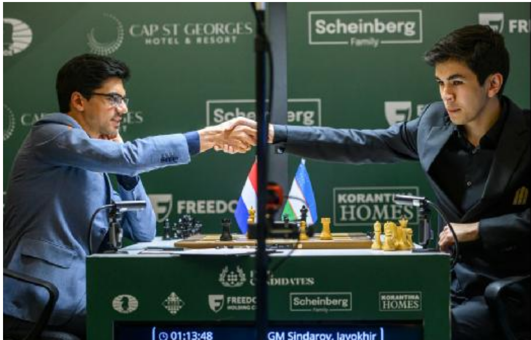
O empate que deu o título para Sindarov

O ano de virada de Sindarov foi 2025: ele começou o ano com rating 2692 e terminou com 2726, então o maior da carreira. Dois torneios clássicos foram decisivos. No FIDE Grand Swiss, marcou 6½/11, terminando 1,5 ponto atrás de Giri, vencedor do evento. O momento decisivo veio na Copa do Mundo da FIDE, onde Sindarov permaneceu invicto nas partidas clássicas e acabou conquistando o título, derrotando Wei Yi na final e garantindo sua vaga no Candidates.