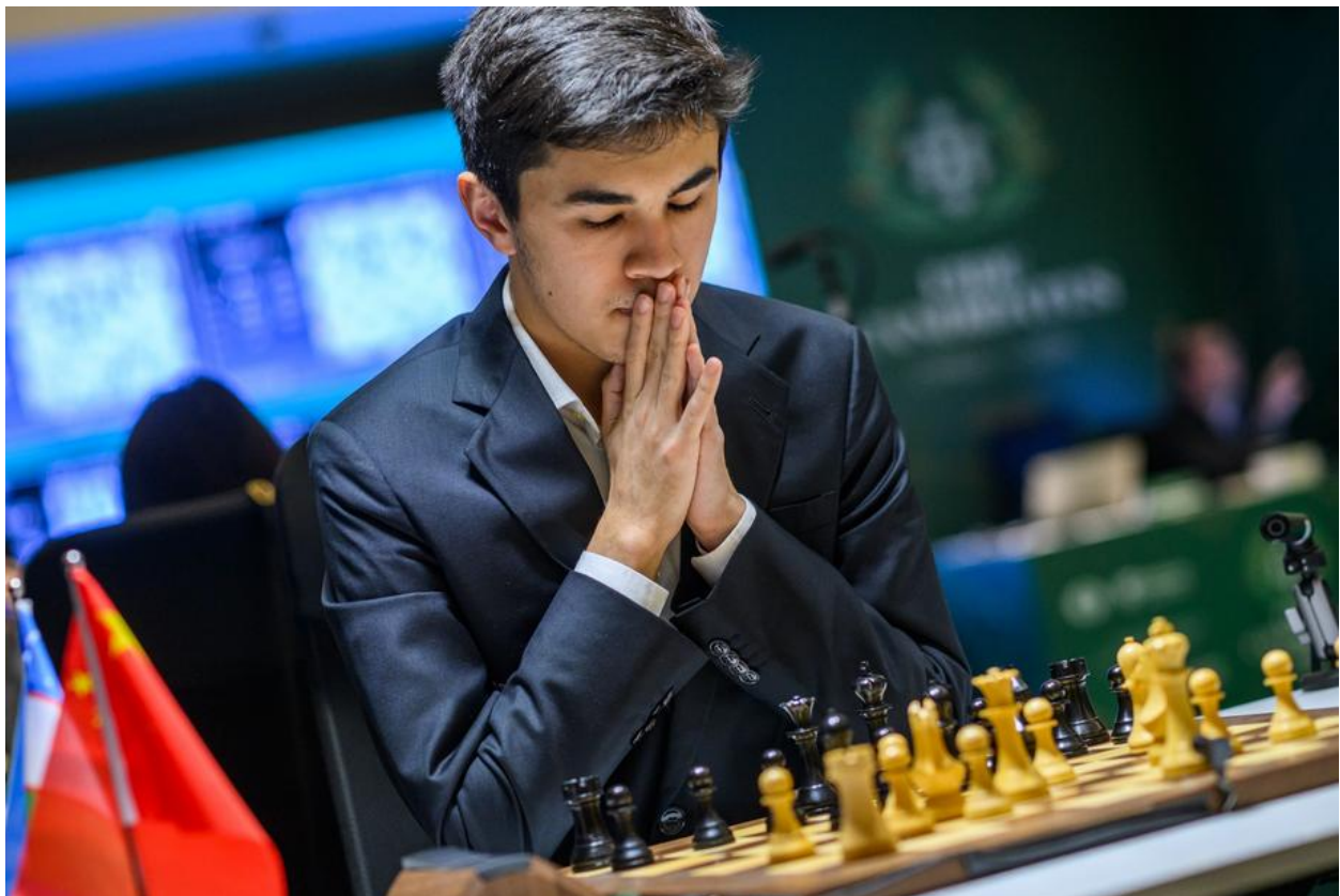
Sindarov concentrado durante o jogo

A impressionante sequência de Javokhir Sindarov continuou na sexta rodada do Torneio de Candidatos, em Chipre, ao derrotar Wei Yi com as peças pretas e alcançar 5,5 pontos em 6. O uzbeque de 20 anos agora lidera com 1,5 ponto de vantagem sobre Fabiano Caruana, enquanto o restante do grupo está ainda mais atrás. As outras três partidas terminaram empatadas, deixando Sindarov como líder absoluto antes da última rodada da primeira metade do torneio.