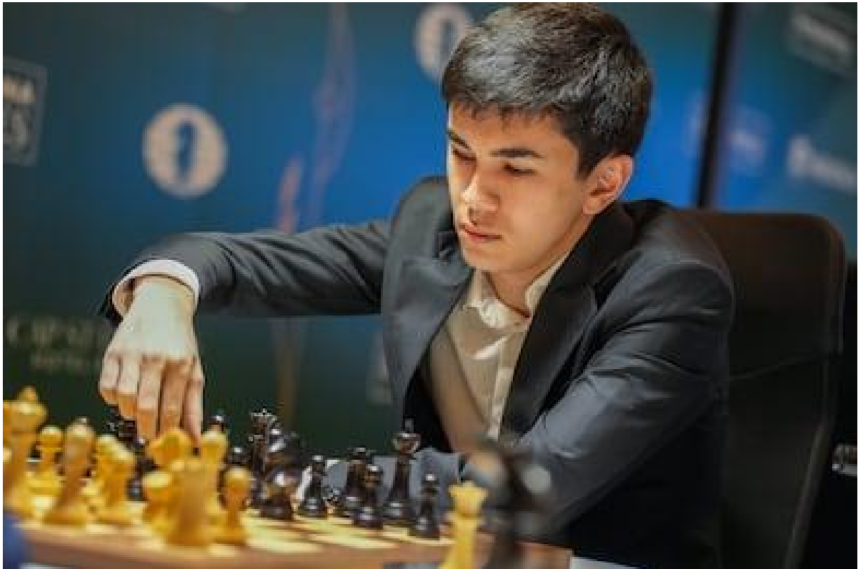
Sindarov, nesta terça-feira, durante a partida em que venceu Praggnanandhaa.

O americano Hikaru Nakamura, nº 2 do mundo, também não conseguiu vencer desta vez, após a derrota para Caruana na rodada inaugural e o empate de segunda-feira contra o russo Andrey Esipenko. Nesta terça, jogava de brancas, mas o holandês Anish Giri se mostrou sólido como de costume e forçou o empate sem grandes dificuldades.