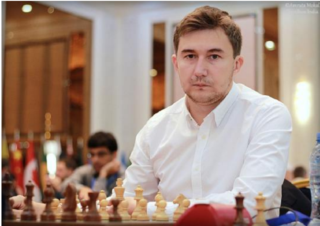
Sergey Karjakin se ganó su plaza en el Torneo de Candidatos en marzo de 2016

De los ocho participantes, hasta la fecha únicamente se conoce el nombre de uno: Sergey Karjakin (Rusia), quien fue eliminado en la Copa del Mundo, pero todavía puede competir porque es el ex retador del Campeón del Mundo en funciones.