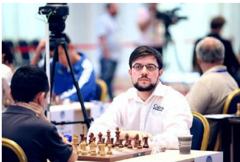
Vachier-Lagrave durante la tercera ronda de desempates

La tarea de Vachier-Lagrave todavía parece más complicada. Necesitaría quedarse subcampeón o bien empatar por el primer puesto (de ser posible con más puntos que los otros dos) en Mallorca, para sumar suficientes puntos de Grand Prix para asegurarse una plaza a través de esa competición.