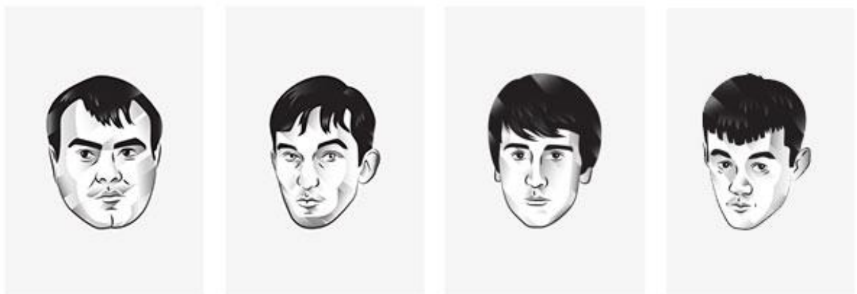
Mamedyarov, Grischuk, Radjabov, y Ding Liren tiene buenas posibilidades

De aquellos dos jugadores que hayan sumado la mayor cantidad de puntos hasta ahora, dos ya han participado en tres de los torneos: Shakhriyar Mamedyarov y Alexander Grischuk. Pero, al resto todavía les queda por disputar uno más (del 16 al 27 de noviembre en Palma de Mallorca) y teóricamente ahí aún podrían adelantar a los dos líderes.