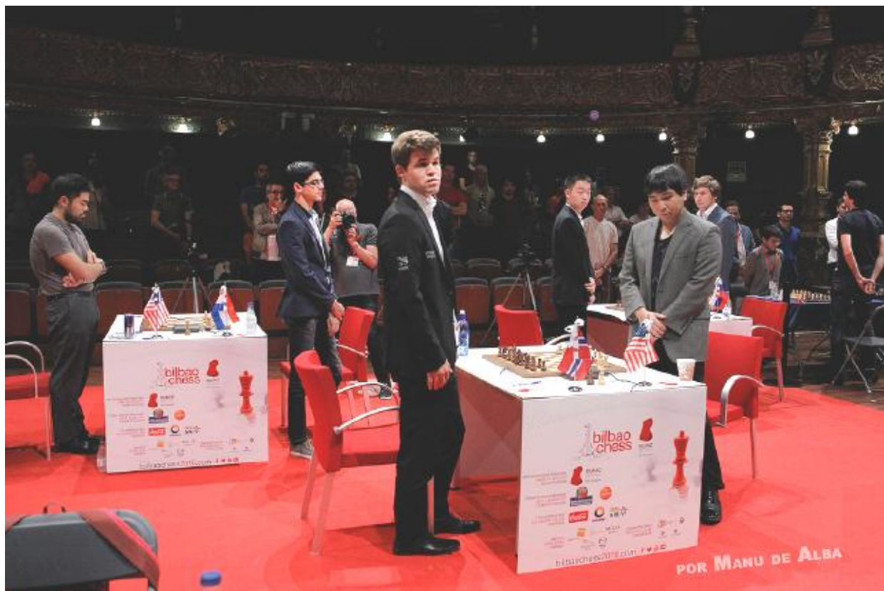
El hombre, en el centro