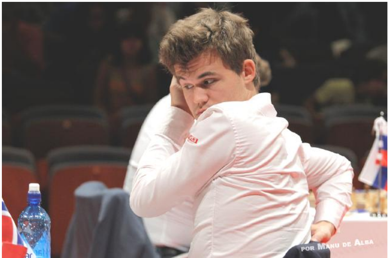
Magnus Carlsen em su partida