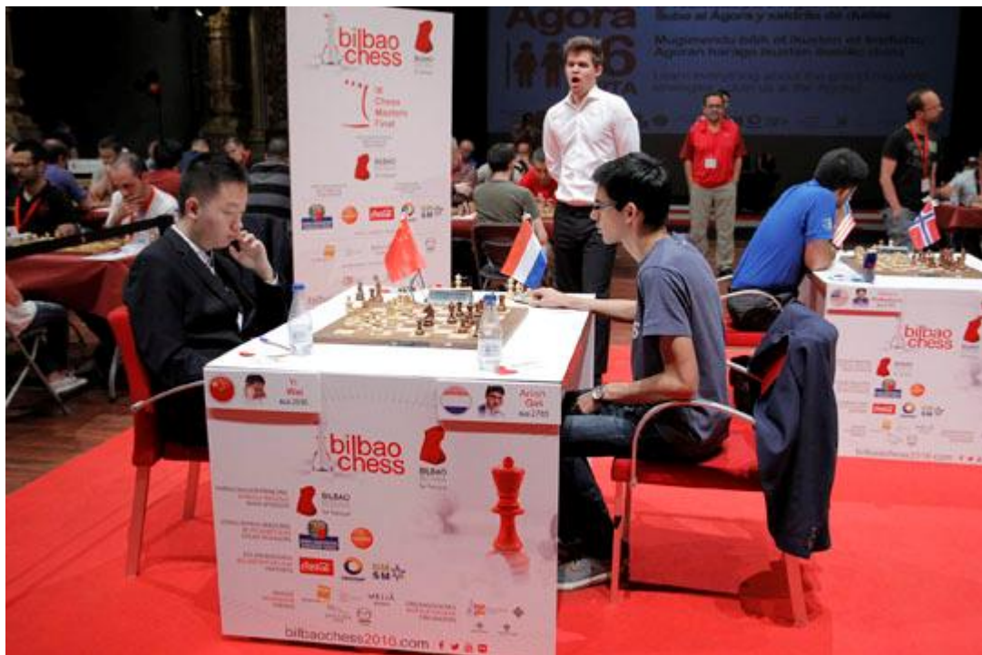
Wei Yi vs. Anish Giri