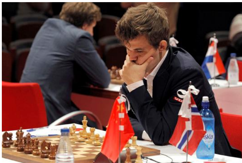
Magnus Carlsen en su partida contra Wei Yi

ANISH GIRI (Holanda) - SERGUEI KARIAKIN (Rusia) (2 horas y 19 minutos/43 movimientos) 1-1