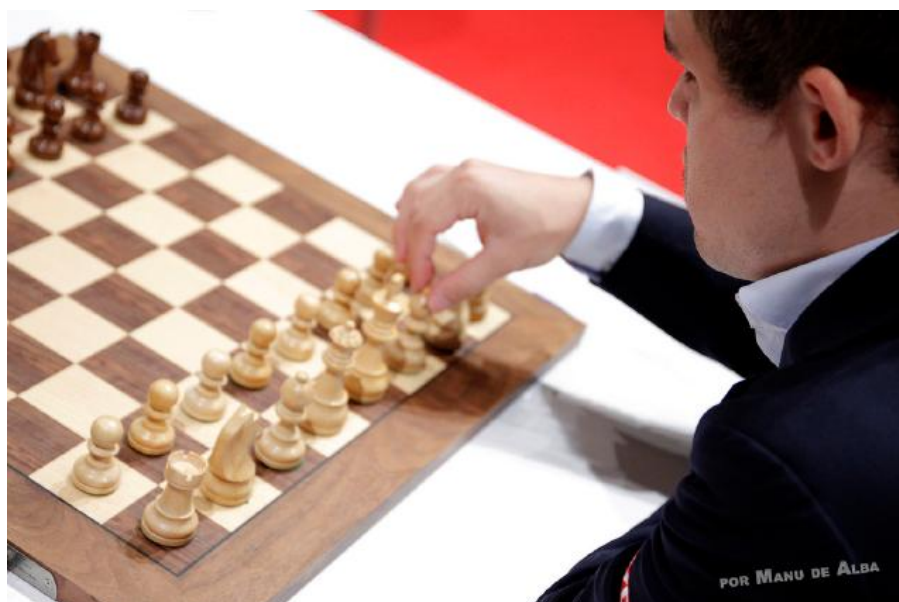
Magnus y el ajuste de las piezas antes del comienzo del juego

HIKARU NAKAMURA (EE.UU) - SERGEY KARJAKIN (Rusia) (1 hora y 34 minutos/34 movimientos) 1-1