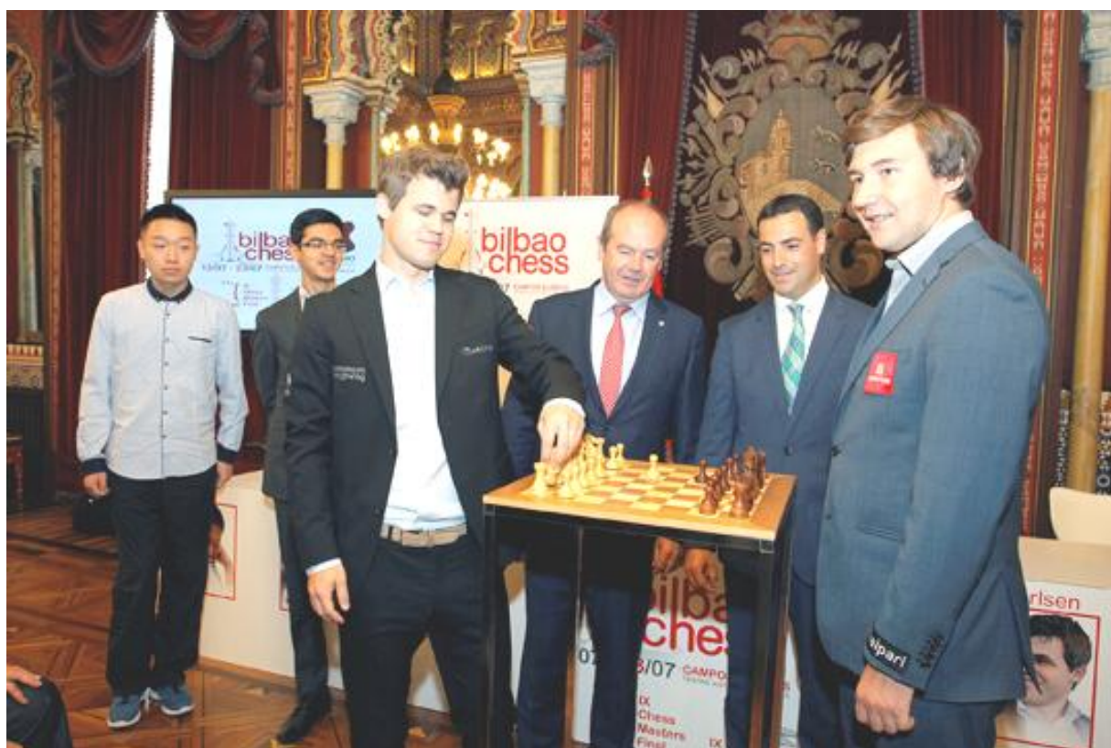
Magnus Carlsen y Sergey Karjakin en el Ayuntamiento de Bilbao

Junto al noruego Carlsen, completan la nómina competitiva de la Final de Maestros más potente de los últimos años, su próximo retador por el título del mundo, el ruso Sergey Karjakin; el vigente campeón del torneo, el estadounidense Wesley So; otros dos de los diez mejores del escalafón mundial, como el también norteamericano Hikaru Nakamura y el holandés Anish Giri. Completa el cartel como sexto contendiente, la emergente nueva estrella mundial, el chino de 16 años Yi Wei.