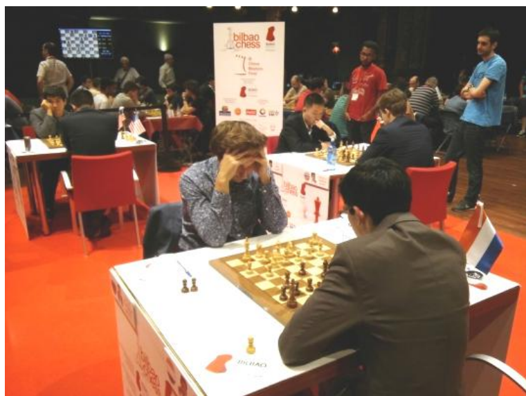
La sala de juego

SERGUÉI KARIAKIN (Rusia) - ANISH GIRI (Holanda) (4 horas y 35 minutos/82 movimientos) 1-1