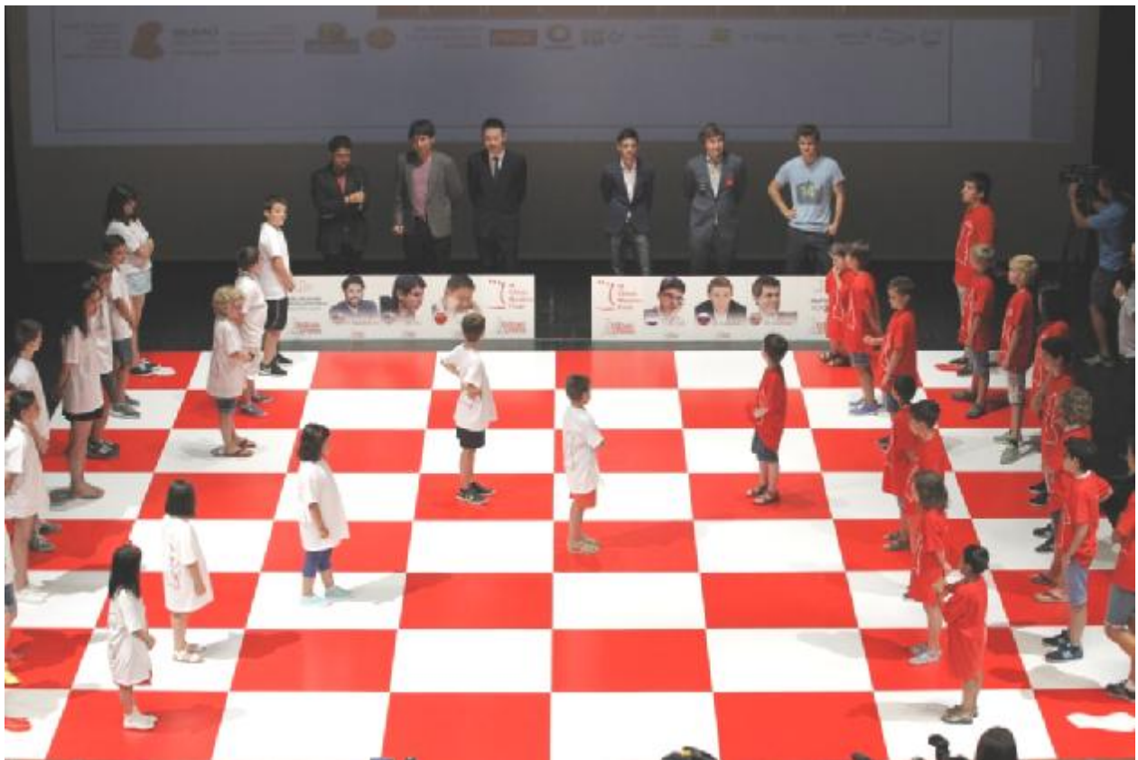
Con los seis jugadores al fondo, 32 niños de colegios vizcainos donde el ajedrez se utiliza como herramienta pedagógica escenificaron las jugadas del encuentro Europa-Resto del Mundo

Carlsen y su retador, el ruso Serguéi Kariakin, fueron compañeros en el equipo europeo, (junto al holandés Anish Giri), que hizo tablas con las piezas negras frente al “Resto del Mundo” (los estadounidenses Hikaru Nakamura y Wesley So, y el chino Yi Wei). “Hemos jugado mejor y podemos considerarnos vencedores morales, dado que teníamos las negras”, coincidieron.