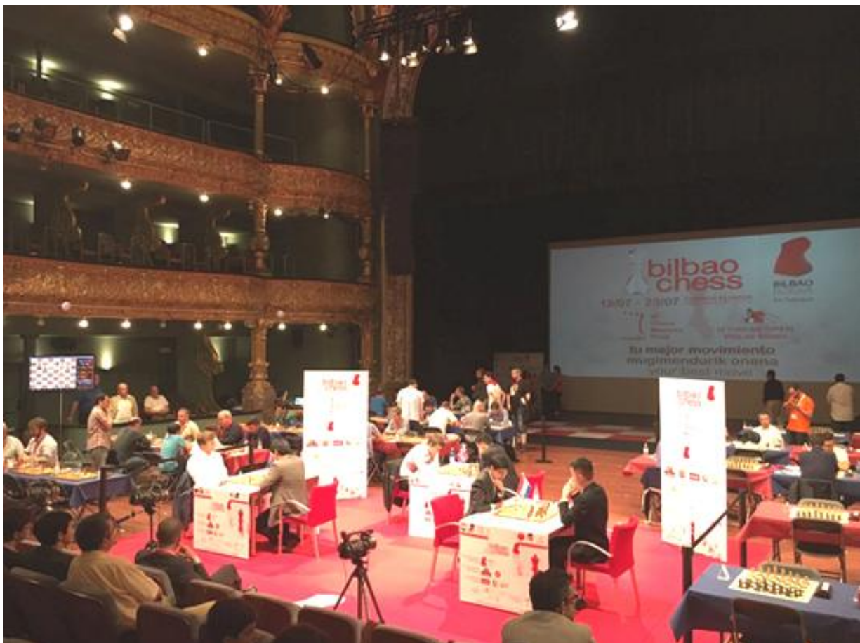
La vista desde el público

Como en ediciones anteriores, las dos competiciones serán retransmitidas en directo por Internet, a través del sitio web oficial del evento, www.bilbaochess2016.com , y de los principales portales internacionales de ajedrez, cuya audiencia conjunta y acumulada sobrepasó el pasado año los diez millones de espectadores en todo el mundo. Los comentarios, conducidos por los comentaristas y ajedrecistas Leontxo García y Santiago González de la Torre, pueden ser seguidos también por el público asistente al evento, en el espacio conocido como el Ágora, por el que pasarán todos los días, además de los competidores de los dos torneos, figuras significadas del ajedrez y de la vida social y cultural de Euskadi.