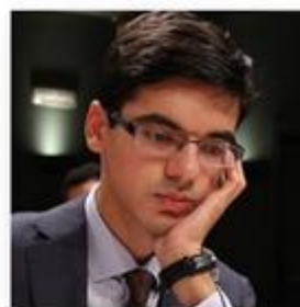
Anish Giri Clasificación: 7

ELO: 2785 28/06/1994 (22 años) RUSIA - HOLANDA