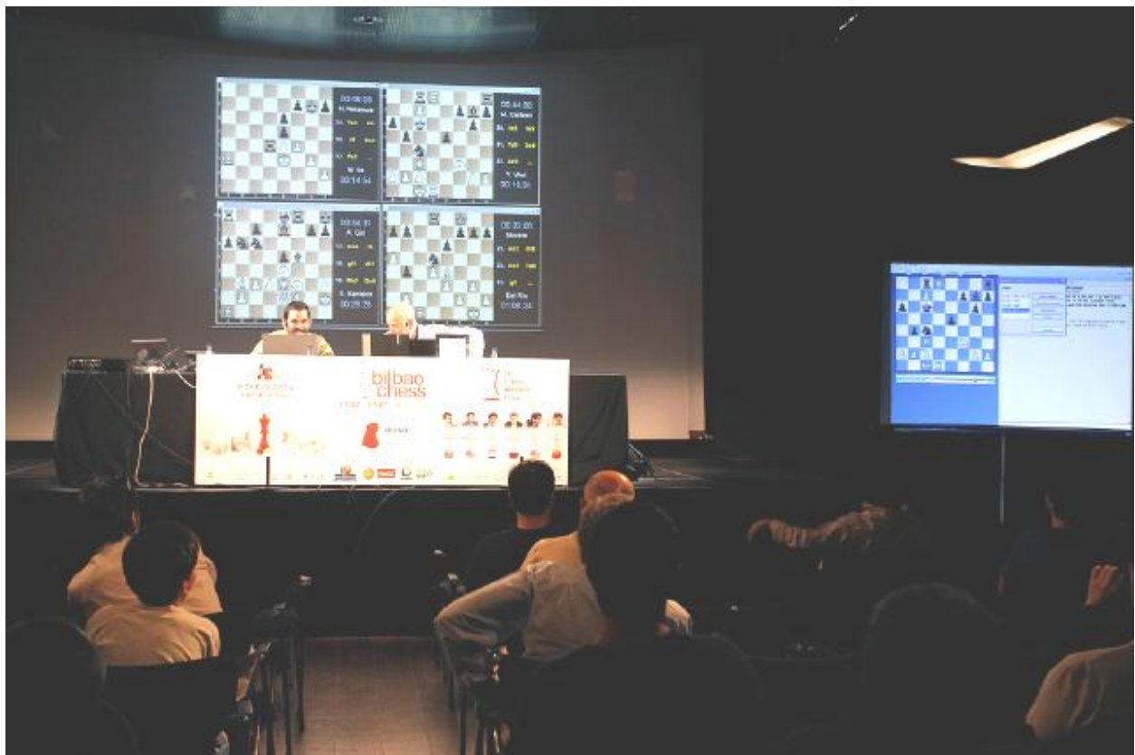
Transmisión de juegos em la pantalla grande

Kariakin, por su parte, llegará a la batalla frente al Carlsen después de un interesante choque con Giri. El ganador del Torneo de Candidatos ha planteado con sus piezas blancas una apertura Italiana que ha encontrado la agresiva oposición del holandés a partir del sexto movimiento. La estrategia, calcada a la ya utilizada por Levon Aronian frente al Carlsen, ha dado paso a una fase de juego muy abierta. El holandés se ha mostrado decidido en el intercambio de material, pero la gran defensa de Kariakin ha nivelado la balanza dándole incluso por momentos una ligera ventaja sobre el tablero.