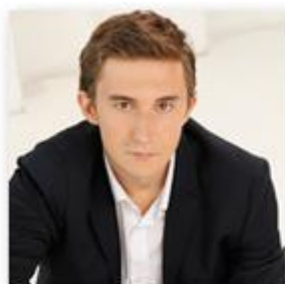
Sergéi Kariakin Clasificación: 9

ELO: 2785 28/06/1994 (22 años) RUSIA - HOLANDA