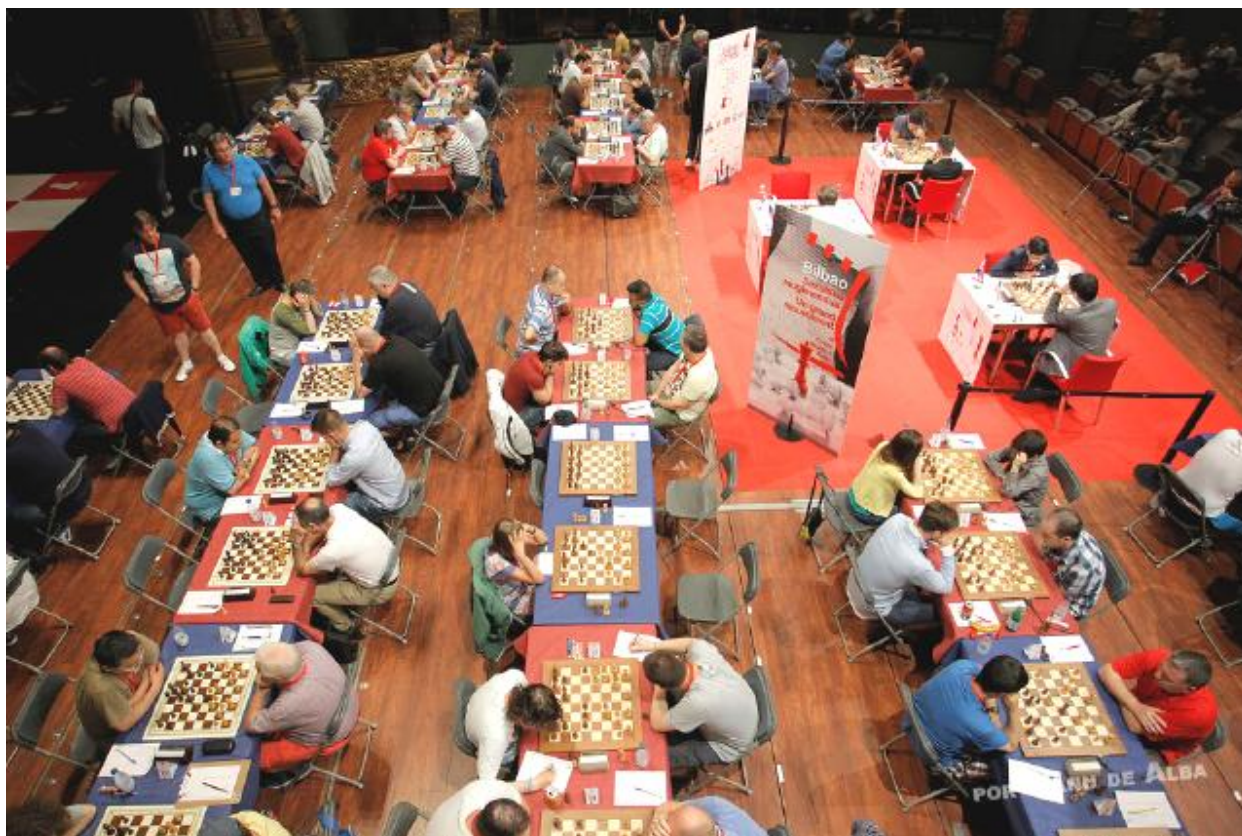
El torneo abierto.

El torneo abierto. Este torneo se lleva a cabo en paralelo al torneo principal y ofrece un premio de tres mil euros para el primer lugar y yendo a un centenar de euros para el vigésimo puesto, además de premios por categoría. Hay seis categorías y cada uno ofrece un premio adicional, y 250 euros para el primer lugar en cada categoría. Son las categorías: