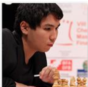
Wesley So Clasificación: 11

ELO: 2773 12/01/1990 (26 años) UCRANIA - RUSIA