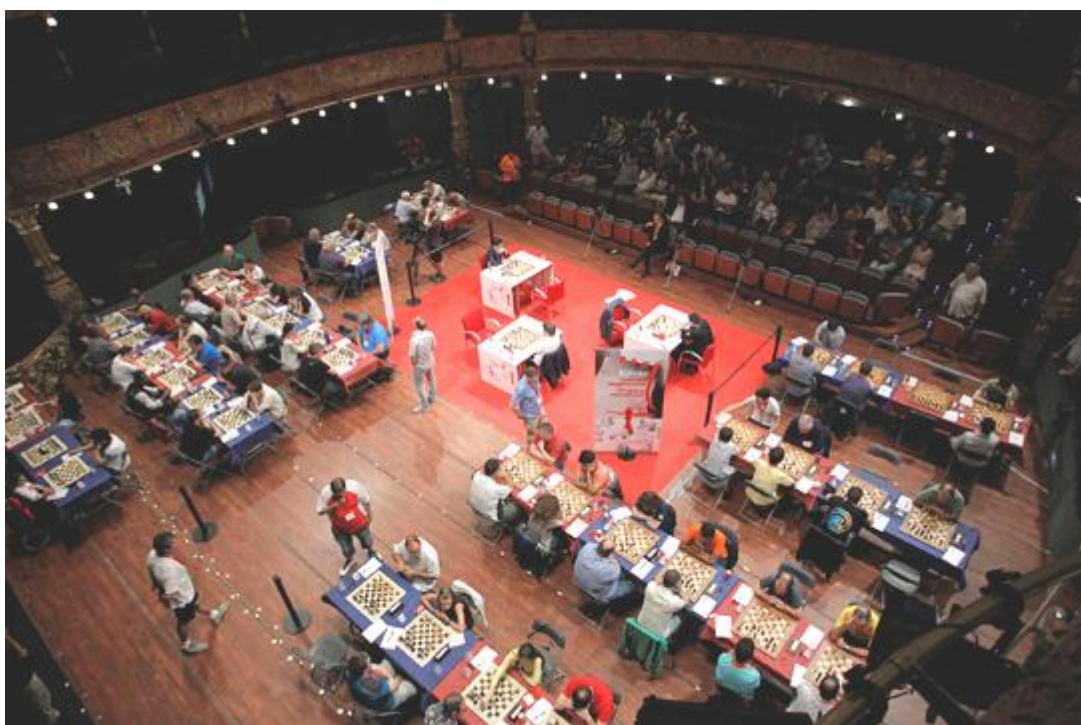
La sala de juego con también los juegos del torneo abierto

YI WEI (CHINA) - SERGUÉI KARIAKIN (Rusia) (1 hora y 55 minutos/23 movimientos) 1-1