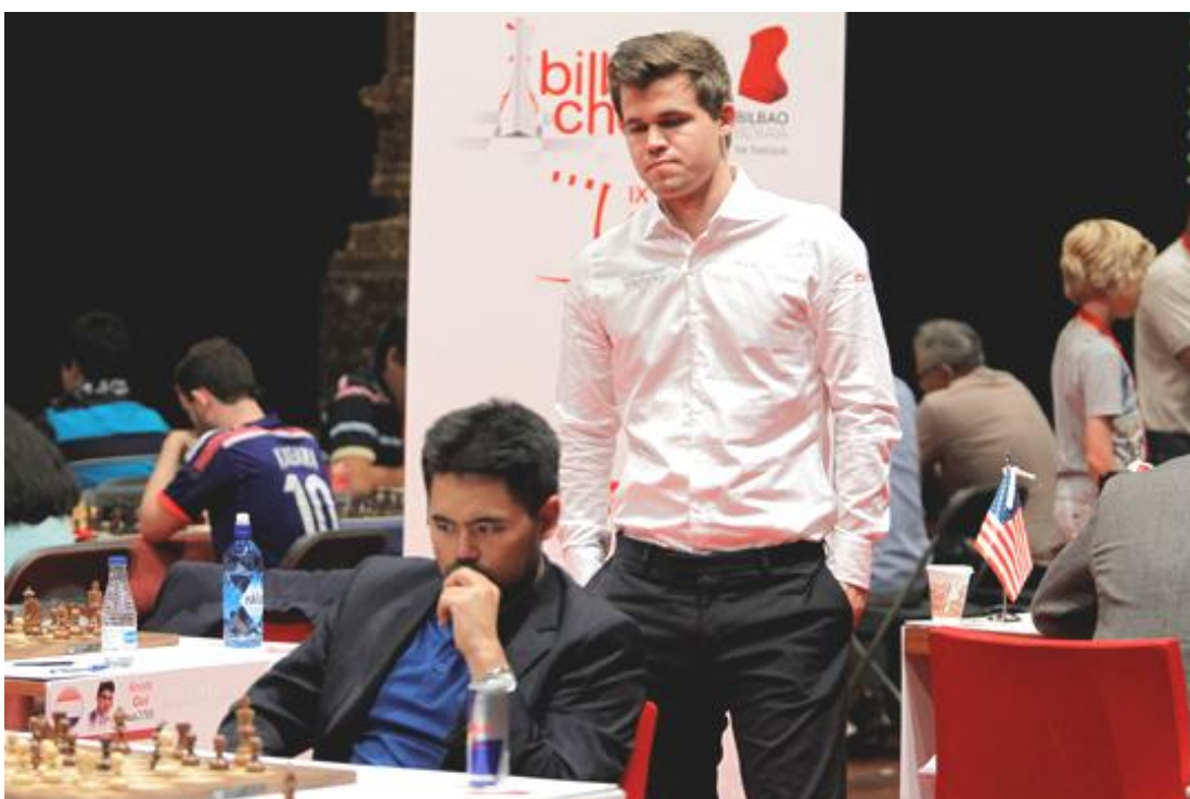
Carlsen, de pie, observa de cerca la partida de Nakamura, ayer en Bilbao

En la mesa en la que se han enfrentado el último ganador de la prestigiosa 'txapela' de campeón en Bilbao, el jugador de origen filipino Wesley So, y la última gran perla del ajedrez chino, el talentoso Yi Wei, se ha llegado a las tablas después de una partida muy clásica y siempre nivelada. La variante Petrov inicial por parte de las blancas y una posición siempre sólida del material negro manejado por So no ha acarreado ventajas para ninguno de los dos contendientes. Las tablas parecían inevitables, pero la aplicación en esta Final de Maestros de la llamada "regla Sofía", que establece que sólo el árbitro tiene potestad para la determinar el final de la partida, ha alargado el choque hasta los 73 movimientos sin que se hayan producido fisuras en las estructuras defensivas en las tres horas y media de juego.