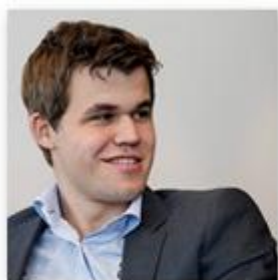
Magnus Carlsen Clasificación: 1