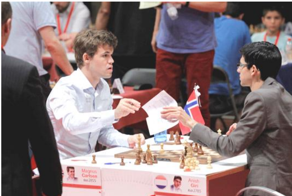
Carlsen acaba de convertirse en el ganador del torneo tras derrotar a Giri, y ambos se intercambian las planillas para firmarlas

La partida estelar de la jornada no ha defraudado. Han sido casi tres horas y media de batalla salpicada de gran riqueza táctica. Tras llegar a una posición de igualdad en las primeras veinte jugadas, Carlsen se ha mantenido fiel a su estilo apretando las tuercas a su rival a costa incluso de ceder material. Giri, que como ha confesado al final de la partida no atraviesa su mejor estado de forma, ha sucumbido a la presión apurado por problemas de tiempo. Un grave error justo antes del control le ha condenado. El noruego ha afiliado el colmillo y ha acabado devorando a su rival obligándole al abandono después de 45 movimientos.