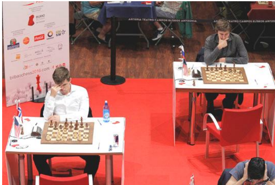
Magnus e karjakin pensando

El cara a cara de esta sexta ronda era sin duda el que medía en la primera mesa a Nakamura con un Carlsen tremendamente motivado, tanto por el rival que tenía enfrente como por las tablas que cedió antes del día de descanso. El noruego abandonó enfurecido la sala de análisis y todo hacía prever que iba a descargar toda su artillería para hacer pagar los platos rotos al americano. Sin embargo, la ligera ventaja posicional que le dio a Nakamura su apertura Siciliana atemperó el ímpetu del número 1. En el medio juego, ambos han optado por una línea creativa tratando buscar el desequilibrio en el intercambio de piezas. El desarrollo, sin embargo, ha derivado en una posición de igualdad que ha abocado a las tablas.