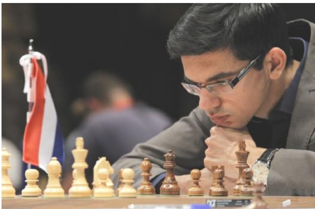
Anish Giri, uno de los tres participantes que aún no han logrado una victoria; los otros son Kariakin y So

Dos de los tres participantes que aún no han logrado una victoria se enfrentaban ayer entre sí. Pero el holandés Anish Giri estaba aún tocado por la derrota ante Wei el martes, y eligió con blancas una línea pétrea, poco apropiada para ganar ante un defensor tan duro como Kariakin. De modo que el empate no sorprendió a nadie.