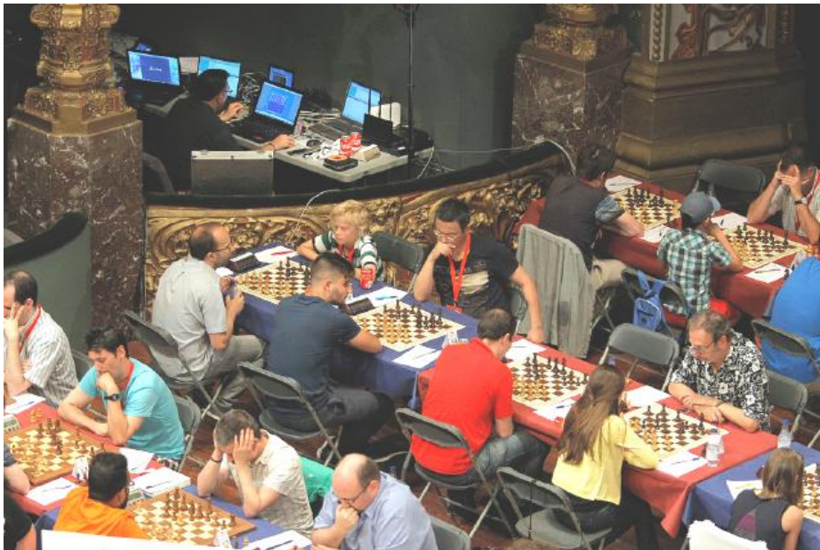
El torneo abierto

La partida más corta de lo que va de torneo, menos de dos horas, se ha desarrollado en la mesa donde pugnaban Sergey Karjakin y el joven Yi Wei, los dos jugadores que cerraban la clasificación al inicio de la jornada. Ha sido un duelo "tranquilo", como la definido más tarde el ruso. El aspirante al trono mundial ha defendido correctamente la apertura Catalana desarrollada por el chino amenazando incluso las aparentes debilidades blancas. El intercambio de material ha dejado a los contendientes en posiciones muy sólidas que ninguno de los dos ha estado dispuesto a debilitar. Las lógicas tablas por triple repetición han otorgado a ambos su tercer punto del torneo.