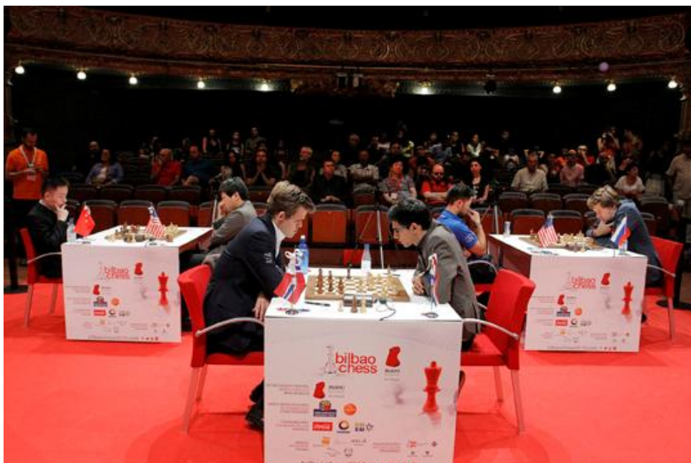
Magnus Carlsen y Anish Giri

WESLEY SO (EE.UU) - YI WEI (CHINA) (3 horas y 30 minutos/73 movimientos) 1-1