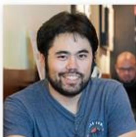
Hikaru Nakamura Clasificación: 6