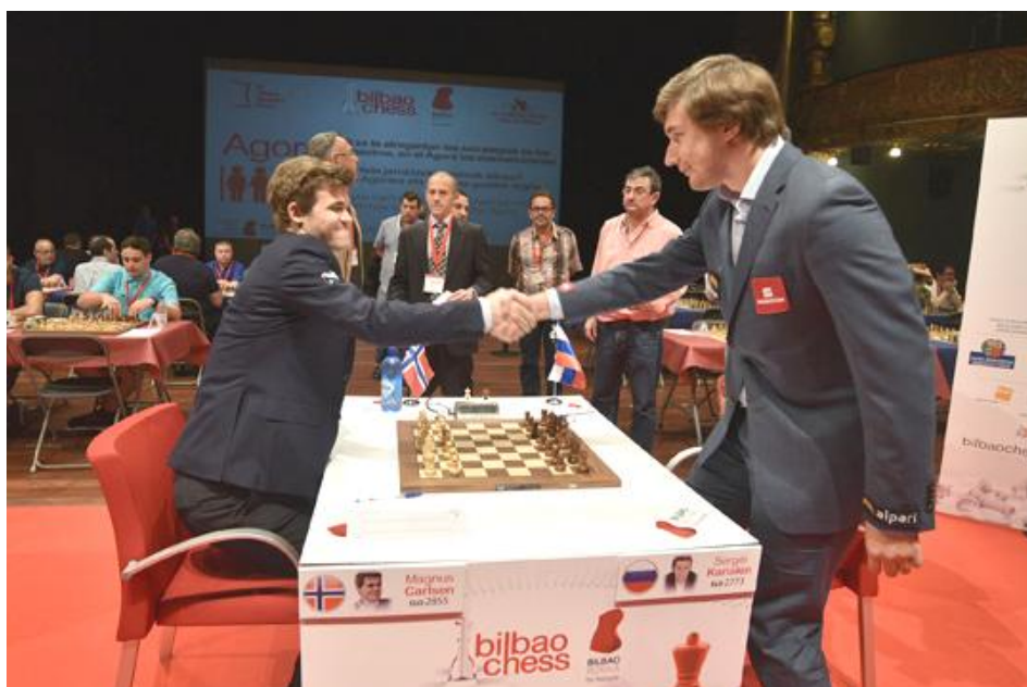
Magnus Carlsen y Sergey Karjakin saludándose