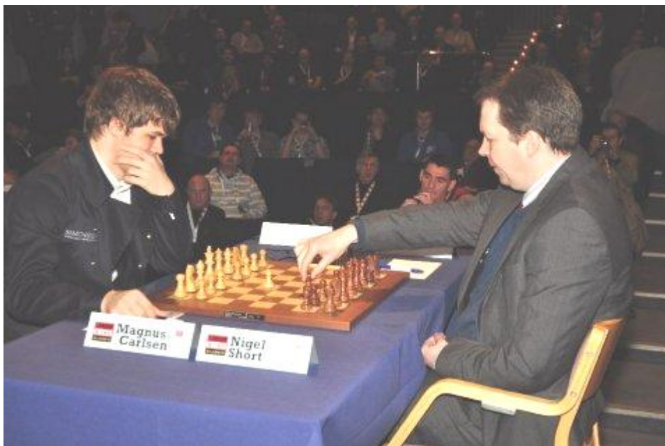
Carlsen vs. Short

Creo que cualquiera diría que Fabiano Caruana, tras la serie victoriosa de torneos que ha jugado. Desde luego, sus resultados en los torneos del año pasado han sido extraordinarios. Veremos si sigue así. Pero también podría haber otros para ponerle freno a Carlsen.