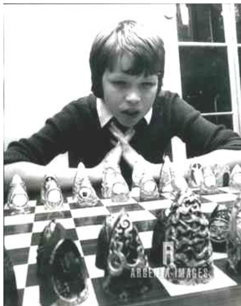
Nigel Short de muy joven

Es un famoso gran maestro. No conozco muy a fondo sus partidas. Pero me he dado cuenta de que solía tener un repertorio de aperturas algo limitado. Si su repertorio hubiese sido más amplio, seguramente habría tenido todavía más éxitos como jugador activo.