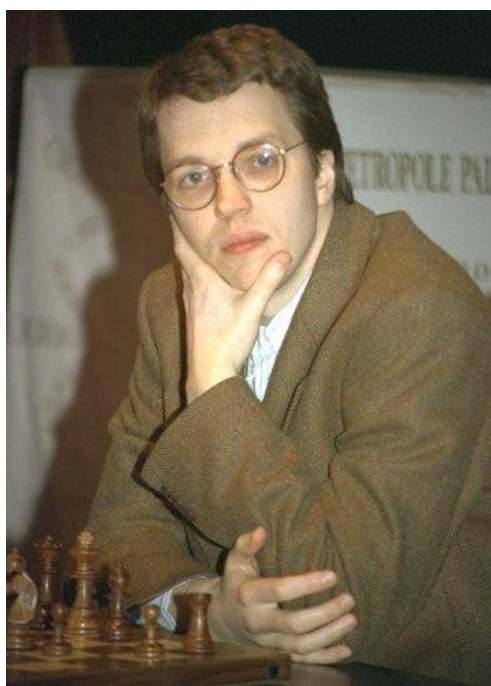
En Monte Carlo - 1993

Creo que estamos viviendo una época muy poco apropiada para el ajedrez.