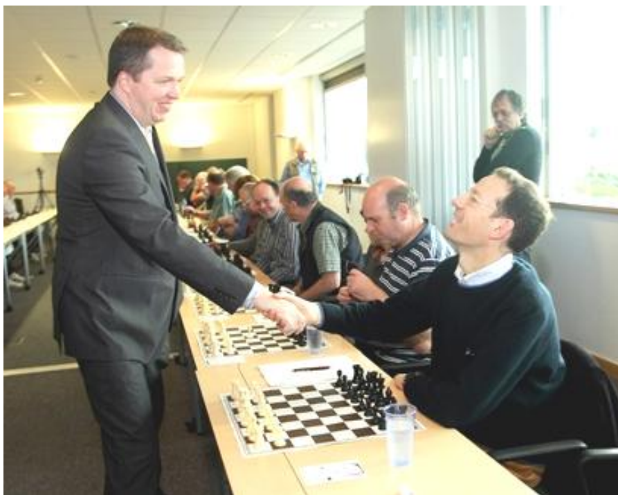
Short en una simultánea

Vives en Atenas con tu familia desde hace muchos años. ¿Te has planteado regresar a Inglaterra algún día?