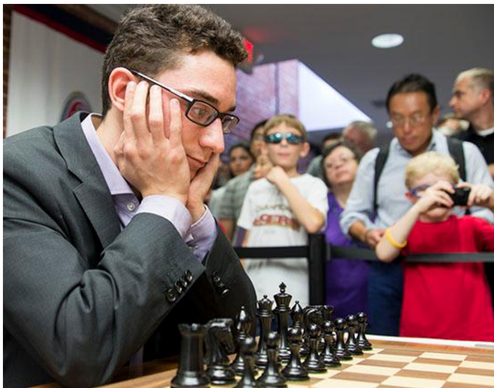
Fabiano Caruana lidera con 5/5 y con 2,5 puntos de ventaja frente a los más cercanos perseguidores, Topalov y Carlsen

La línea que Nakamura jugó contra la Eslava de Caruana, no fue la más retadora, pero Caruana cometió un ligero error y la pareja de alfiles de Nakamura le deben haber causado cierto dolor de barriga. Sin embargo, durante el medio juego las cosas se torcieron para Nakamura y no para Caruana. El estadounidense subestimó el contraataque de Caruana y las piezas negras una tras otra saltaron para apuntarse a la "misión vence Nakamura". Las blancas soltaron lastre (un peón), pero no les sirvió para salvar la embarcación.