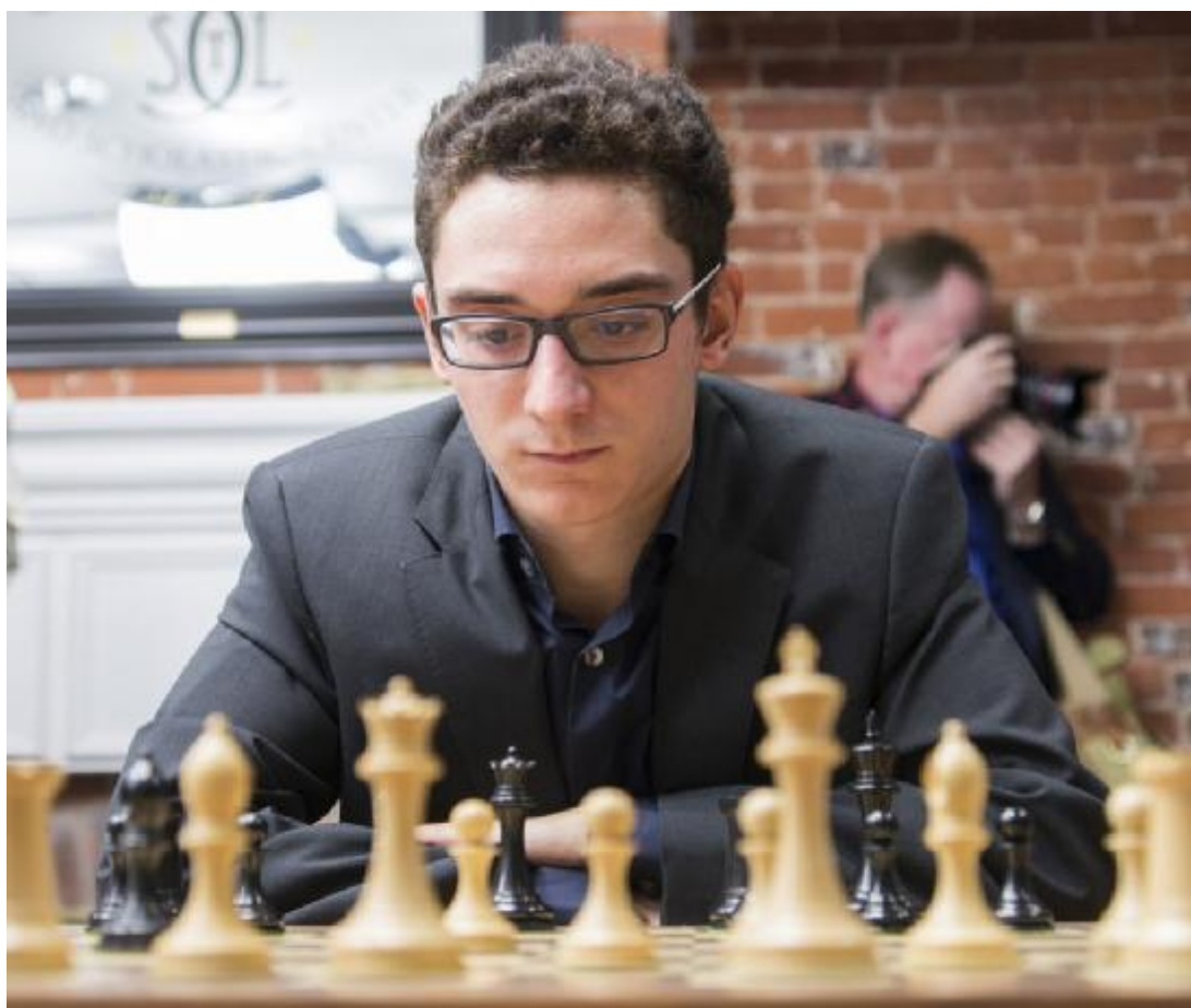
Fabiano Caruana se coronó campeón de la Copa Sinquefield

07/09/2014 – Aunque en la última ronda hubo tres empates poco reñidos, los seguidores de la Copa Sinquefield no tienen motivo de queja. El torneo contó con muchas partidas preciosas y una de las rachas victoriosas más impresionantes, quizá la más espectacular de la historia del ajedrez. Magnus Carlsen ganó la lucha por el segundo puesto y Topalov quedó tercero.