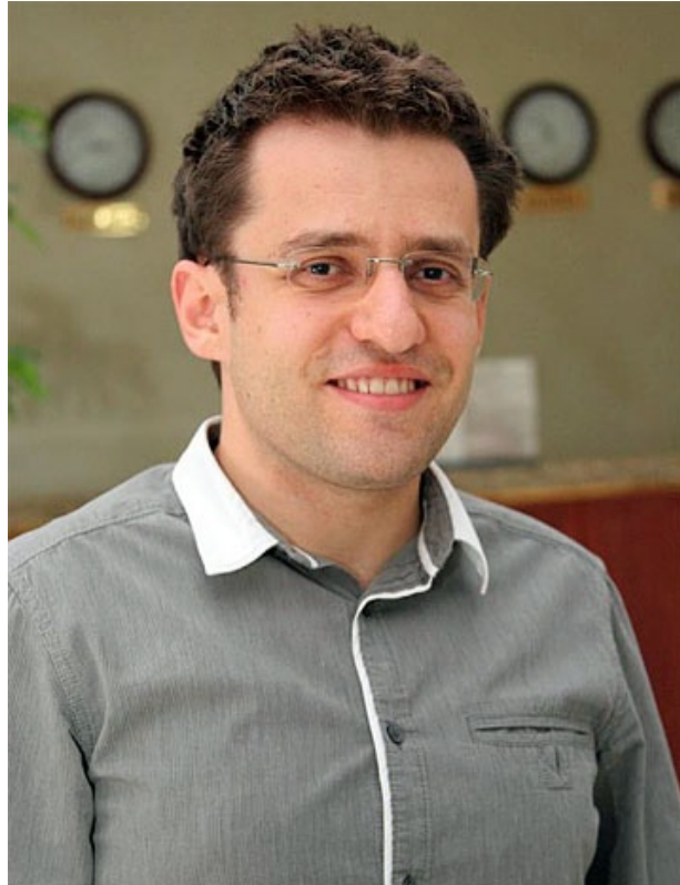
Simpático y amable por naturaleza: Aronian

Aronian tiene un carácter inmejorable. No hay ningún gran maestro más simpático y más amable que él. No hay nadie que no se llevaría bien con él. Pero en Bakú, donde se iba a disputar el Torneo de Candidatos en primer lugar, se habría negado a jugar (Red. ChessBase: por los problemas políticos entre Armenia y Azerbaiyán).