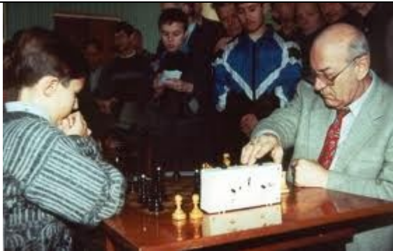
Karjakin jugando contra Viktor Korchnoi hace muchos años