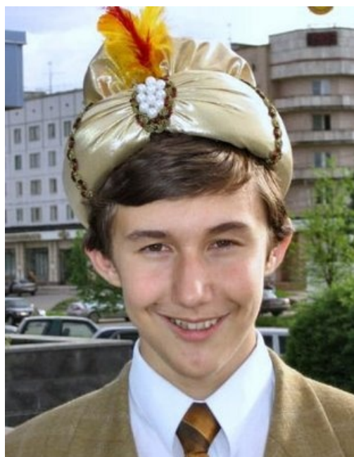
Sergey Karjakin sí que es un ajedrecista alegre, con un gran sentido del humor

Hay un gran maestro que forma parte de los 10 mejores a quien le encanta gastar bromas. De vez en cuando nos llama por teléfono a los demás para presentarse como nuevo representante de si mismo. Ofrece organizar un duelo y mientras que la víctima que ha recibido la llamada aún está medio bamboleando entre sorpresa e interés, se echa a reír todo lo alto y cuelga. ¡No me pregunto por nombres! No voy a decir quién eso.