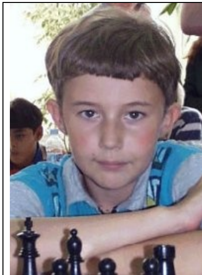
Sergey Karjakin, gran maestro a los 12 años y 7 meses, el 20 de agosto de 2002

Medio año antes Ud. había entrado de manera espectacular como entrenador de Ruslan Ponomariov en el duelo por el título mundial. Si Ud. lo mira de manera objetiva ahora, ¿le pudo ayudar en aquel entonces?