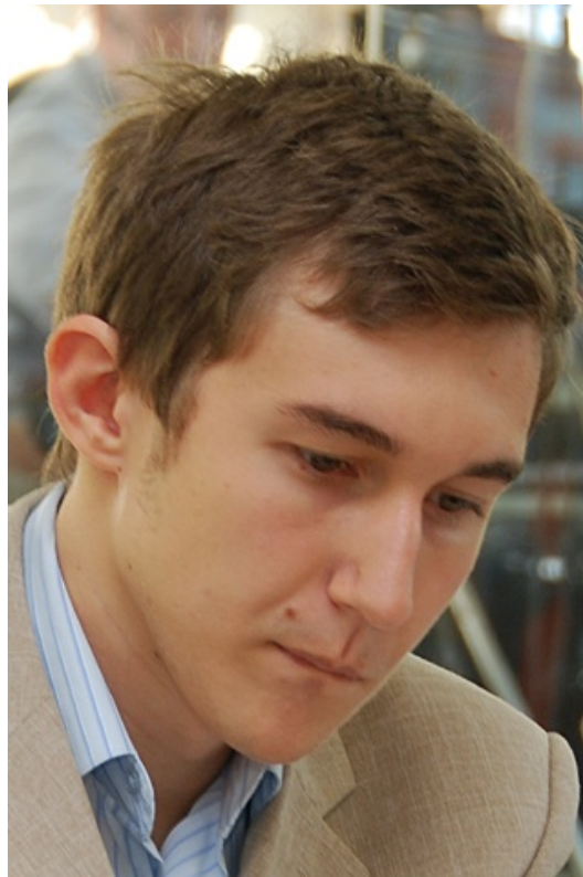
No es posible contentar siempre a todos