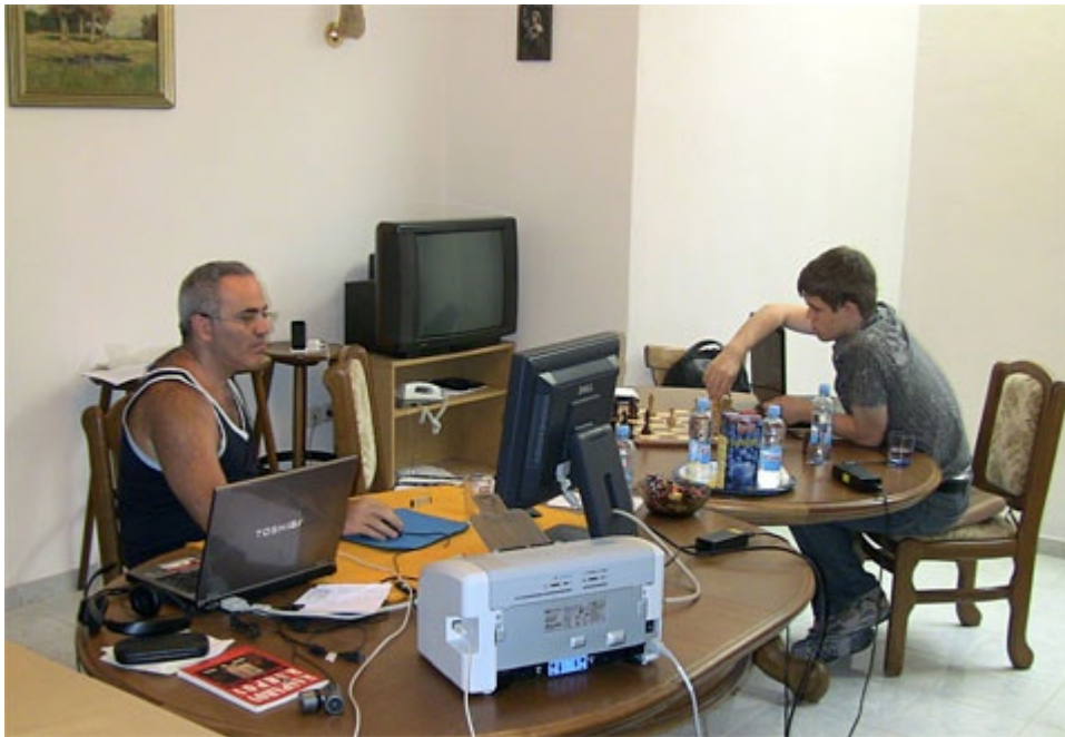
Kasparov y Carlsen en una sesión de entrenamiento que realizaron en Croacia en 2009

Carlsen cuenta con el apoyo de varias empresas multinacionales y no hace falta que se preocupe de sus tareas. ¿Cómo es eso en su caso, Sr. Karjakin?