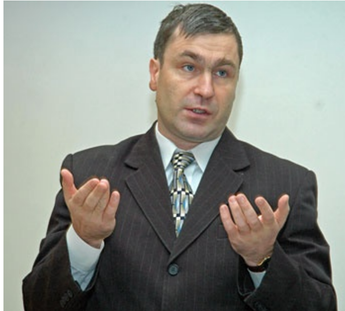
Vassily Ivanchuk, un hombre con principios

Para Ivanchuk no hay peor cosa que que alguien debe realizar el primer movimiento por él. En la olimpiada, cuando aún jugaba para el equipo de Ucrania, surgió tal situación. Iba a jugar contra Aronian y alguien de las autoridades iba a realizar el saque de honor. Ivanchuk dijo entre los dientes y en inglés: "¡Ni se le ocurra...!"