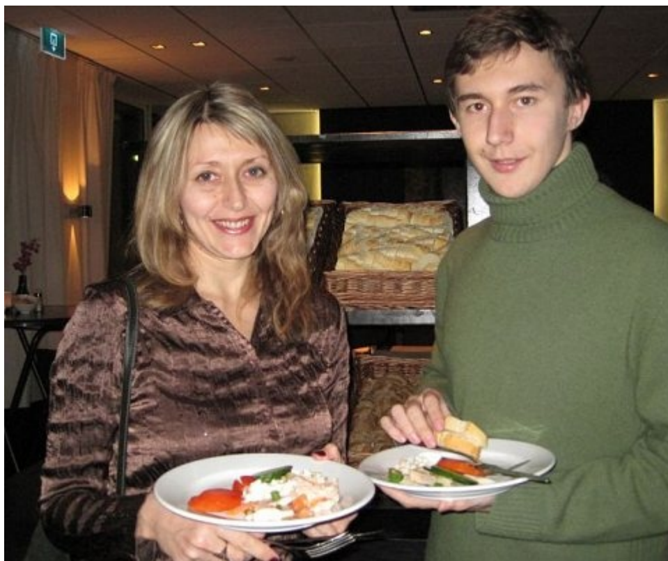
Sergey Karjakin con su madre