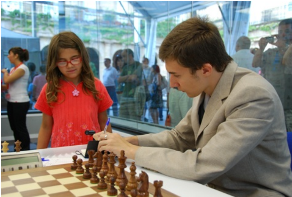
¡Karjakin firmando autógrafos - con un bolígrafo, ¡rotuladores no, por favor!