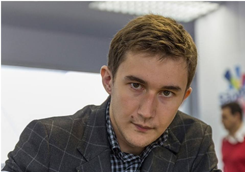
Sergey Karjakin, ex niño prodigio y récord Guinness como GM más joven de la historia