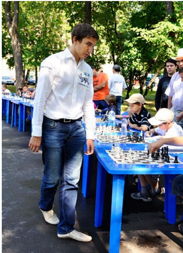
Karjakin jugando una exhibición de partidas simultáneas