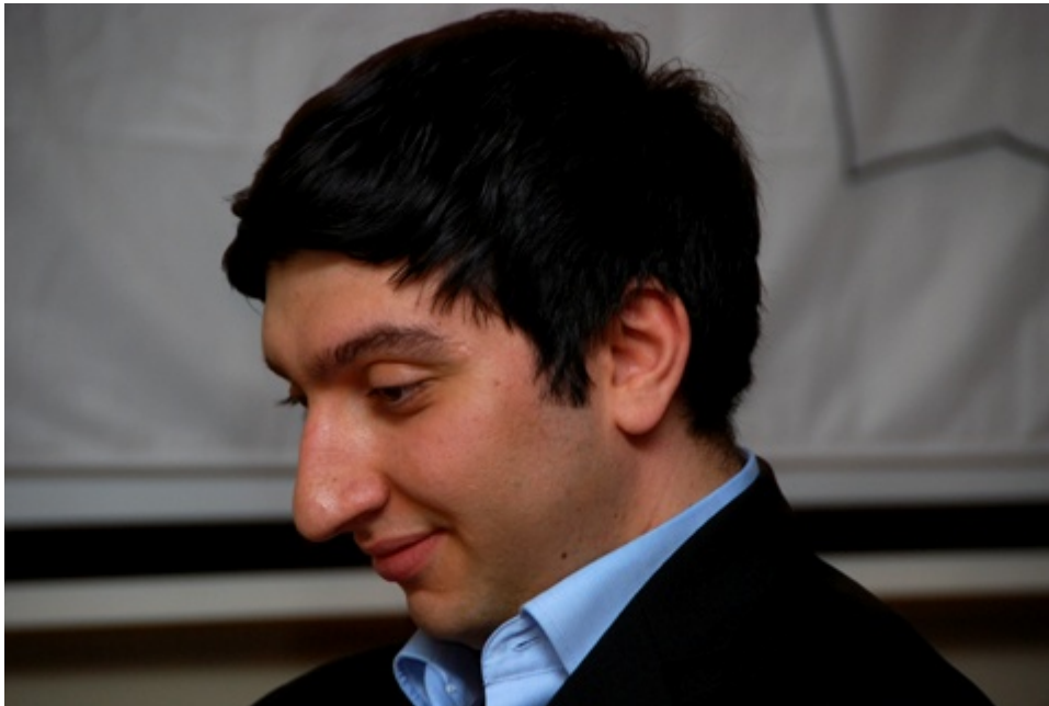
Vugar Gashimov, el mejor amigo de Karjakin entre los ajedrecistas de elite

Cuando tenía 10 años me asusté. Prefiero no hablar de eso.