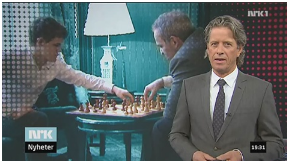
Carlsen y Kasparov en el telediario de la televisión noruega