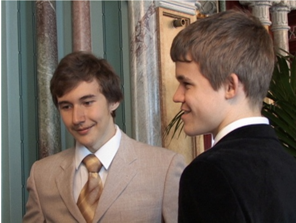
Sergey Karjakin (Ucrania-Rusia) y Magnus Carlsen (Noruega)