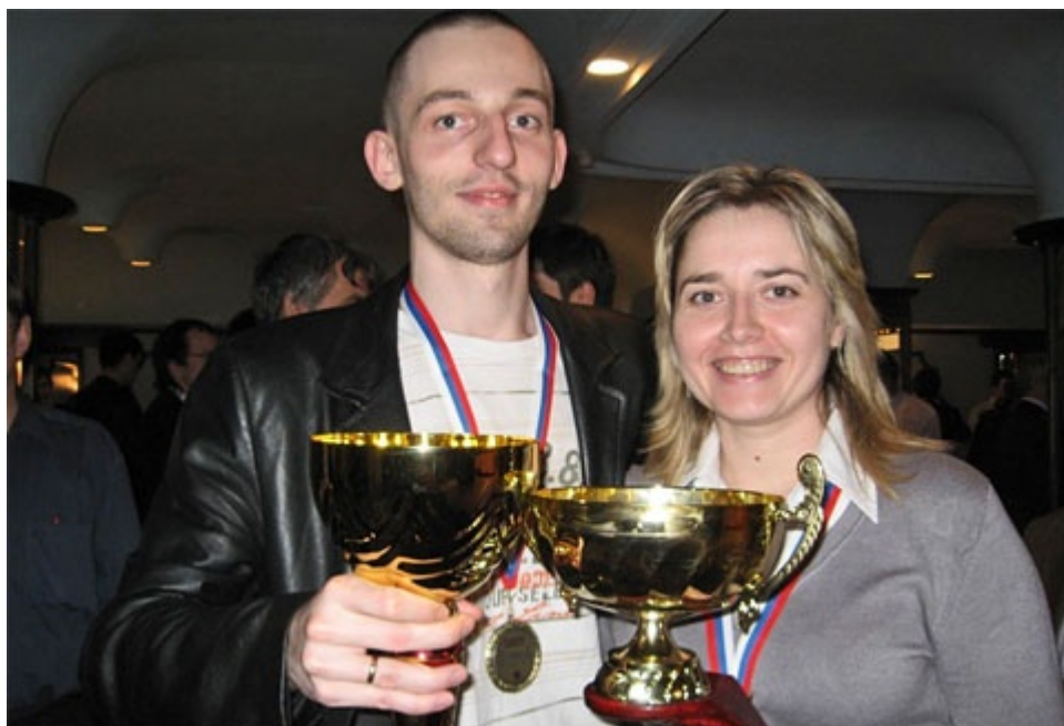
Exiten matrimonios duraderos y felices entre ajedrecistas: Alexander Grischuk y Natalia Zhukova