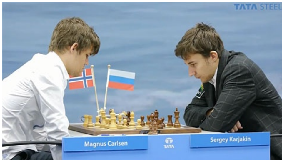
Carlsen vs. Karjakin en Wijk aan Zee 2013