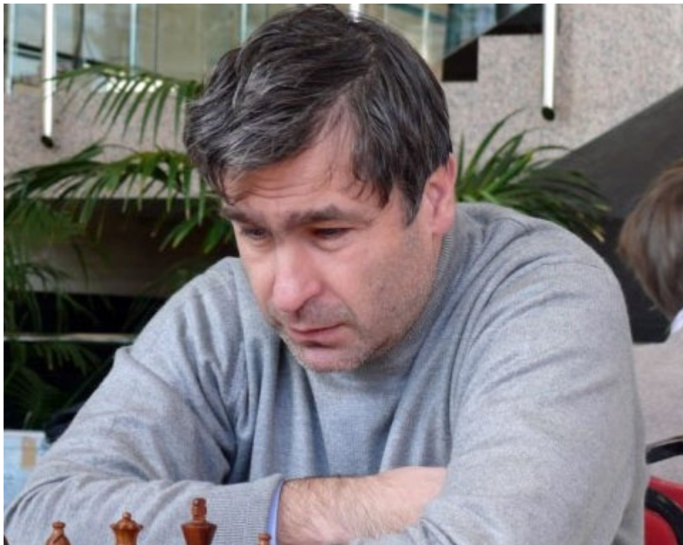
Vassily Ivanchuk, se alegra mucho si gana, pero también sufre mucho si pierde

En un torneo en China, Ivanchuk perdió contra mí en una posición igualada. Simplemente perdió. Oí un grito repentino casi como si fuese de dolor y cuando lo miré vi que se echaba a llorar.