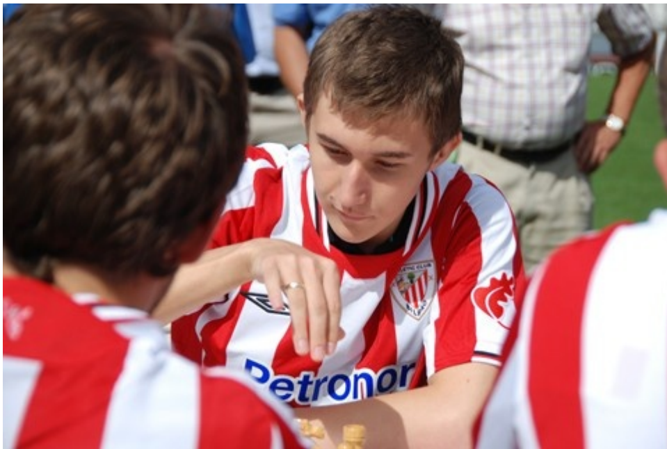
Karjakin jugando al ajedrez con camiseta del Atléctic en San Mamés, el estadio de fútbol de Bilbao contra la selección del club (de fútbol) en 2009

Hace tres años ha cambiado de nacionalidad y se mudó a Rusia; ahora es ruso en lugar de ucranio. ¿Hay pocas perspectivas en Ucrania?